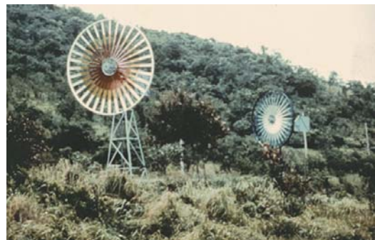
กังหันลมแบบแกนนอน ที่บริเวณบ้านอ่าวไผ่ อ.ศรีราชา จ.ชลบุรี

งานศึกษาและทดลองใช้ประโยชน์จากพลังงานลมเพื่อผลิตไฟฟ้า เป็นส่วนหนึ่งในแผนการพัฒนาพลังงานทดแทนของการไฟฟ้าฝ่ายผลิตแห่งประเทศไทย (กฟผ.) โดยมีจุดประสงค์เพื่อพัฒนาพลังงานลมมาใช้ประโยชน์ในการผลิตกระแสไฟฟ้า และเพื่อบรรลุถึงวัตถุประสงค์ กฟผ. ได้ศึกษาและติดตามวิทยากรด้านนี้ทั้งในและต่างประเทศ อีกทั้งได้สาธิต ทดสอบ ตลอดจนคิดตั้งกังหันลมขึ้นทดลองใช้งาน และเก็บข้อมูลของการทดสอบ เพื่อใช้เป็นแนวทางที่จะพัฒนาระบบให้ดีขึ้นและให้เหมาะสมกับสภาพภูมิอากาศของประเทศไทยต่อไปในอนาคต