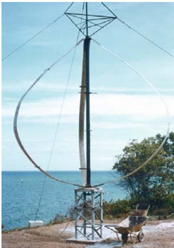
กังหันลมแบบแกนตั้ง ที่บริเวณบ้านอ่าวไผ่ อ.ศรีราชา จ.ชลบุรี

“พลังงานลม” เป็นพลังงานธรรมชาติที่สะอาดและบริสุทธิ์ ใช้แล้วไม่มีวันหมดสิ้นไปจากโลก ได้รับความสนใจนำมาพัฒนาให้เกิดประโยชน์อย่างกว้างขวาง ในขณะเดียวกัน กังหันลม ก็เป็นอุปกรณ์ชนิดหนึ่งที่สามารถนำพลังงานลมมาใช้ให้เป็นประโยชน์ได้ โดยเฉพาะในการผลิตกระแสไฟฟ้าและในการสูบน้ำซึ่งได้ใช้งานกันมาแล้วอย่างแพร่หลายในอดีต