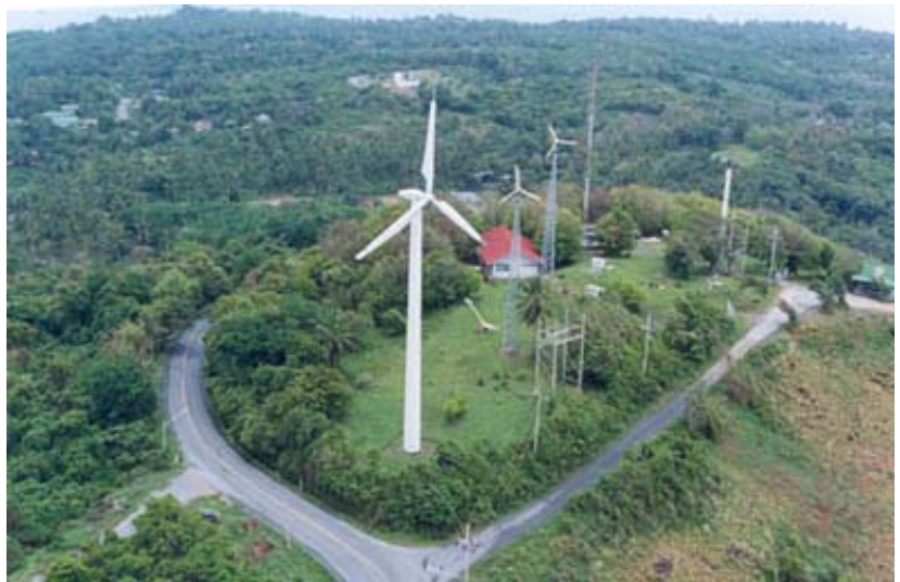
กังหันลมเพื่อการผลิตไฟฟ้า ที่สถานีพลังงานทดแทนพรหมเทพ จ.ภูเก็ต

ค้นหาข้อมูลเพิ่มเติมได้ที่ www.egat.co.th/re