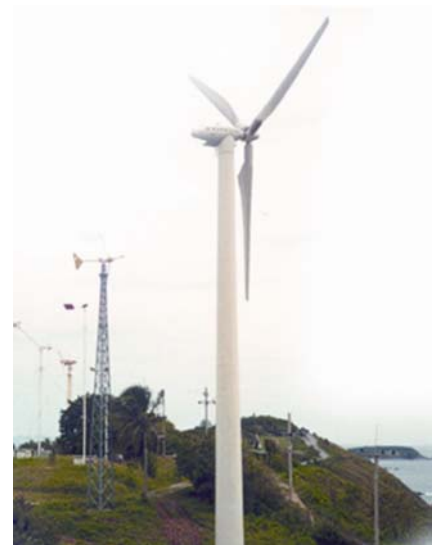
กังหันลม ขนาดกำลังผลิต 150 กิโลวัตต์ ที่สถานีพลังงานทดแทนพรหมเทพ จ.ภูเก็ต

นอกจากนี้ กฟผ. ยังมีแผนงานที่จะติดตั้งกังหันลมขนาดกำลังผลิต 600 กิโลวัตต์ ในบริเวณพื้นที่ดังกล่าว ขณะนี้อยู่ในระหว่างขอรับเงินทุนสนับสนุนจากกองทุนเพื่อส่งเสริมการอนุรักษ์พลังงาน สำนักงานนโยบายและแผนพลังงาน (สนพ.)