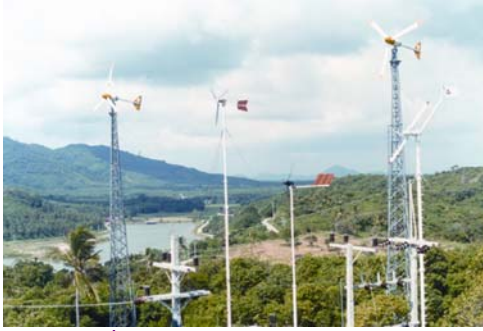
กังหันลมที่สถานีพลังงานทดแทนพรหมเทพ จ.ภูเก็ต

ตั้งแต่ปี พ.ศ. 2526-2535 กฟผ. ได้เริ่มติดตั้งกังหันลมขนาดเล็ก เพื่อทดสอบประสิทธิภาพการผลิตไฟฟ้าที่สถานีแห่งนี้เพิ่มเติมอีก จำนวน 6 ชุด พร้อมทั้งติดตั้งอุปกรณ์บันทึกข้อมูลคือ Digital Data Logger และ Strip Chart Recorder ใ